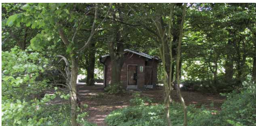
Undanskymd och otrygg toalett i Slottsparken som ska rivas.

Fortfarande finns ett antal gamla toaletter kvar som inte håller dagens krav när det gäller såväl material som trygghet. Dessa kommer på sikt att försvinna. Toaletten i Slottsparken vid Linnéplatsen står undanskymt inne bland träden och upplevs som mycket otrygg. Denna kommer rivas inom kort.