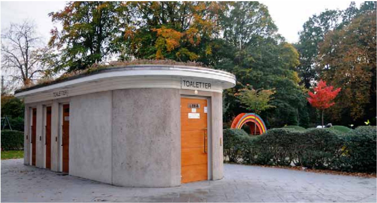
Den nya toaletten vid Sagolekplatsen i Slottsparken.