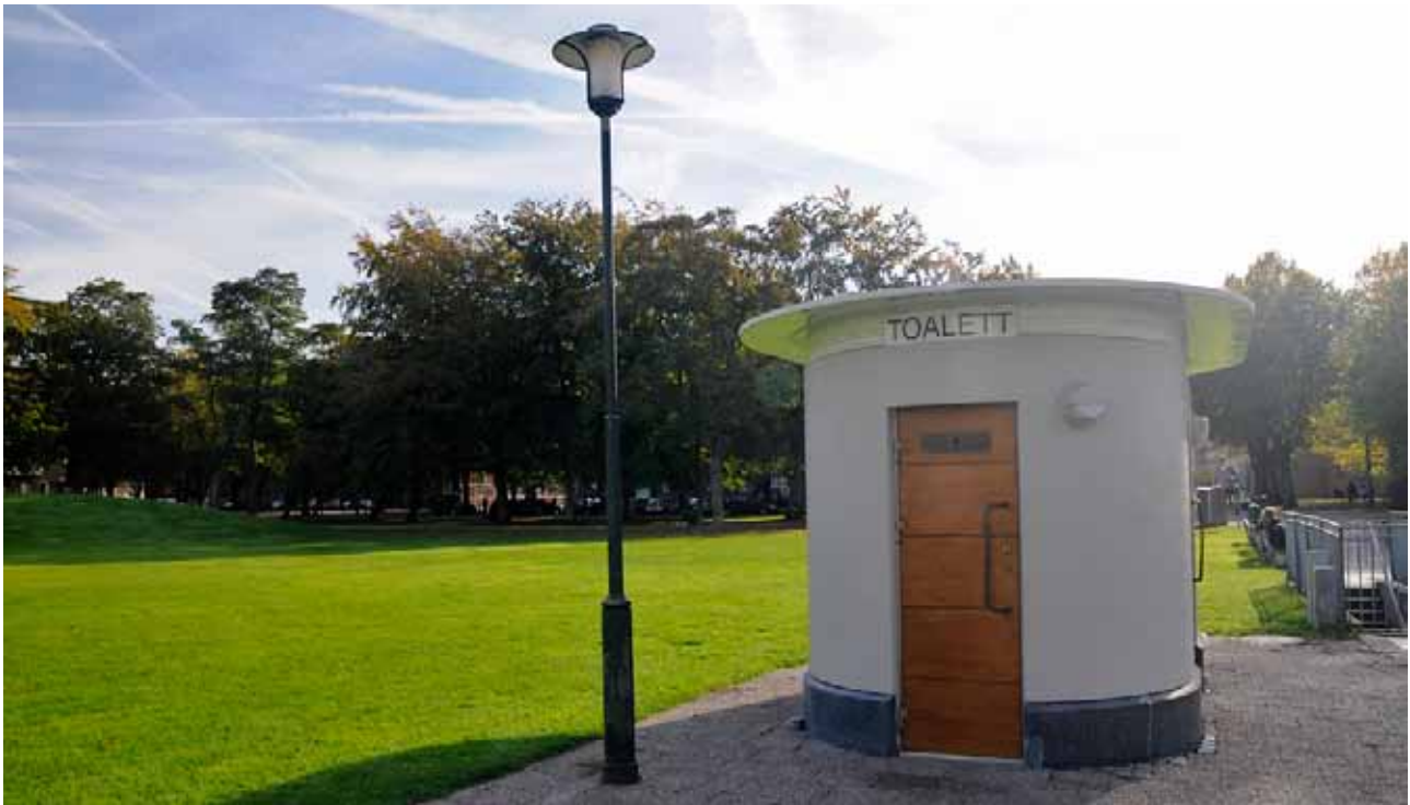
Ny toalett i Rörsjöparken invid plaskdammen.