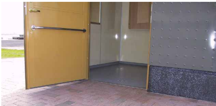
Handkappanpassad entre i toaletten vid Scaniabadet.