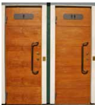
Alla nya toaletter har identiska ekdörrar..

De offentliga toaletterna ska ha en tydlig identitet som är anpassad till dess omgivning. Genom att ha en tydlig identitet på toaletterna minskar behovet av hänvisningsskyltar. För att profilera de offentliga toaletterna, ska det finnas detaljer som återkommer på alla toaletter. Det gäller dörrarnas och handtagens utseende och det gäller ljussättningen av byggnaden. Toaletternas tak ska täckas med sedummattor, som en del i Malmös miljöprofilering.