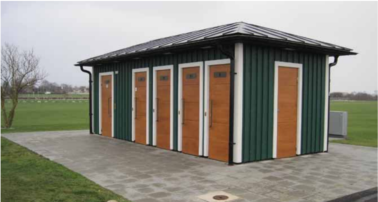
Ny toalett vid T-bryggan på Ribersborgsstranden