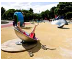
Den lyckade satsningen på temalekplatser ställer nya krav på offentliga toaletter i våra parker. Här Rörelselekplatsen i Enskifteshagen.

Programmet innehåller den målsättning som staden har för nya och upprustade toaletter som är placerade på offentliga platser. Det gäller vilken profil och identitet toaletternas skall ha, var de ska placeras för att möta upp mot nya krav men också vilken standard som gäller för städning, inredning, öppettider och vandalisering. Slutligen redovisas ett förhållningssätt till trygghet och tillgänglighet. Programmet avslutas med en genomgång av statusen för stadens toaletter och vilka behov som finns för nya toaletter framöver och enligt vilken prioritering dessa bör åtgärdas.