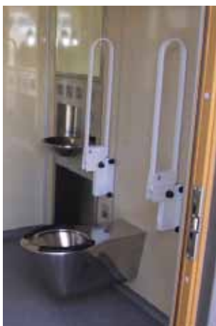
Lättstädad inredning finns v i alla nya toaletter.

Kraven på fräscha och rena toaletter har inneburit att alla vattendrivna pissoarer bytts ut till luktfria pissoarer som inte använder vatten. Detta ger ett renare intryck och sänker både vatten- och energiförbrukningen samt ger lägre driftskostnader. Sedan 2009 byggs även alla toaletter med ett värmeåtervinningssystem som ytterligare minskar energiförbrukningen.