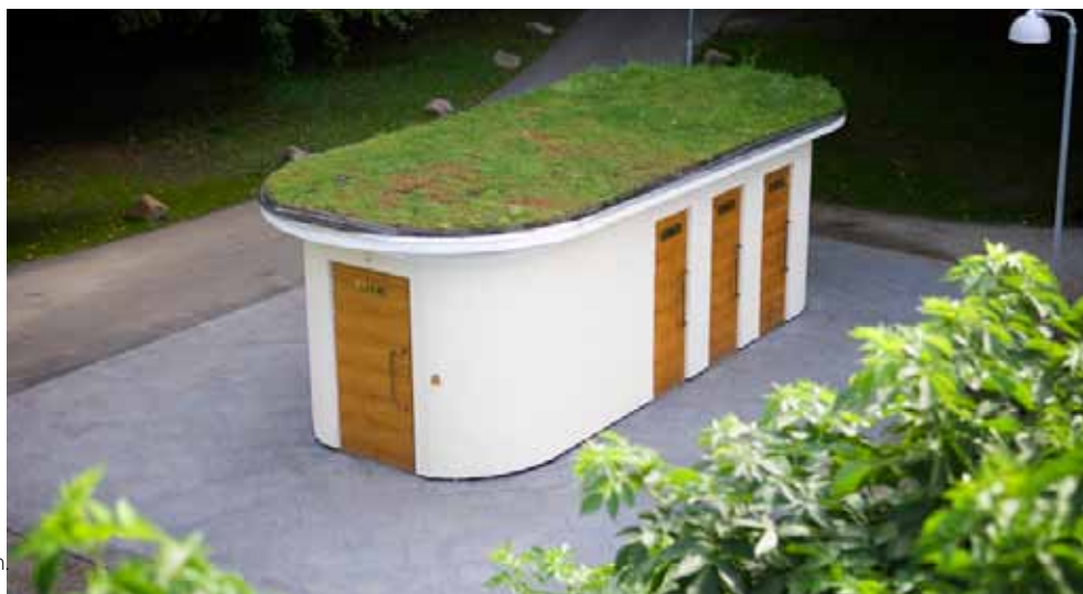
En ny toalett med sedumtak ligger vid friluftsteatern i Pildammsparken.

Färgsättning, taklutning och fasadmaterial skall anpassas till omgivningen och intilliggande byggnader. På så sätt kommer stadens offentliga toaletter bli attraktiva solitärer men med ett sammanhållet gemensamt uttryck.