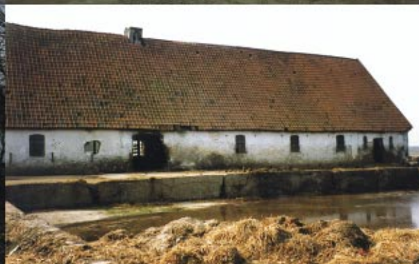
Vykort från början av 1900-talet Betande kor öster om gården. 1950-talet Östra stallängan, västra fasaden, 1992