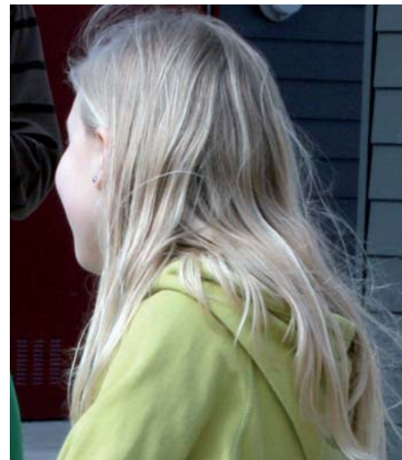
Vilka krav kan man ställa på sin tonåring? På COPE-kursen får du prova nya strategier för att hantera olika situationer med sin tonåring.

Till hösten är det dags för en ny COPE-kurs. Denna gång börjar en kurs för föräldrar som har barn i skolår 5–9. Under nio kvällar diskuterar föräldrarna strategier för att hantera föräldrarollen när man har tonårsbarn.