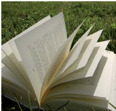
En nyhet i år är att Bunkeflostrands bibliotek även erbjuder "Sommarboken för vuxna".

I år är "Sommarboken" 20 år och det firar vi lite extra med att alla som medverkar också har chans att vinna fina priser som lottas ut.