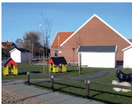
Vintrie förskola invigdes den 15 maj.