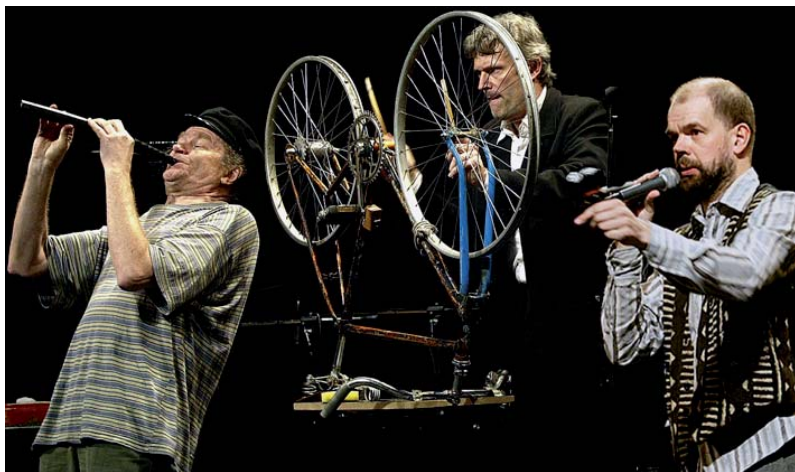
Varieté Velociped som är en musikalisk varietéföreställning från Stockholm. De kommer den 6–7 augusti till Limhamn-Bunkeflo.

Tisdag 23 juni 10.00, 12.00 och 14.00 Grevens park