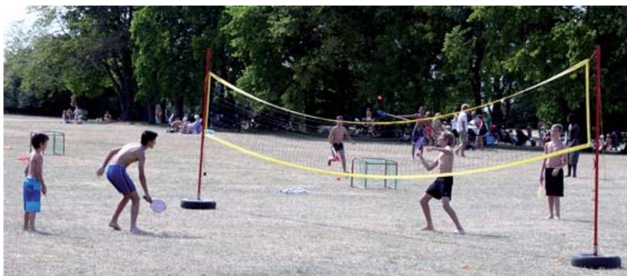
Fritidsgårdarnas sommarverksamhet är ett populärt inslag på stränderna.

På Sommarkul kan man låna strandleksaker, spela volleyboll, fotboll och liknande med fritidsledare. Tävlingar och arrangemang ordnas vissa dagar. För information om detta kan du se schemat nedan och på våra anslag vid respektive strandstation.