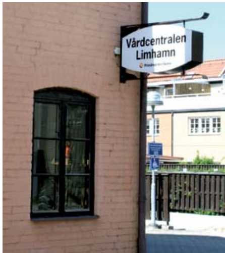
Vårdcentralen Limhamn har lokaler på Odengatan 47.