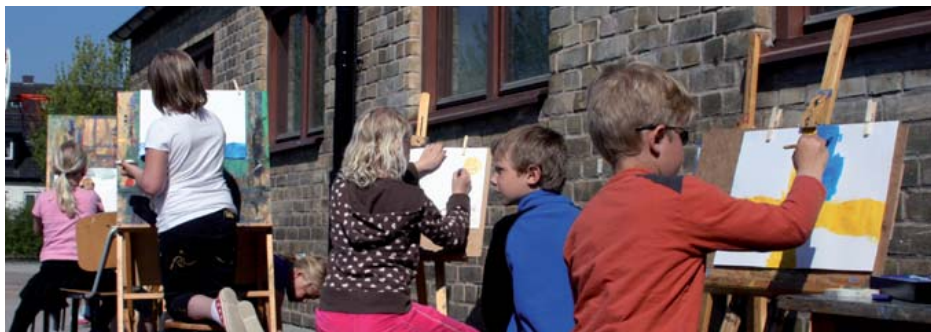
Eleverna på Karl Johanskolan fick prova på staffimålning på kulturtemadagen.

Hela skolan sprudlade av aktiviteter när Karl Johanskolan hade kulturtemadag. Dockteater, tygtryck, modellbygge, magdans och målning var några aktiviteter som eleverna kunde välja mellan.