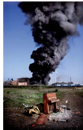
Brand i östra hamnområdet i Malmö.