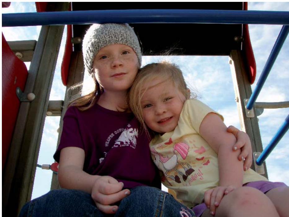
I stadsdelens sparförslag ska nya lokalkostnader undvikas och kärnverksamheter prioriteras.

Tjänster inom administration och verksamhetsledning vakanshålls.