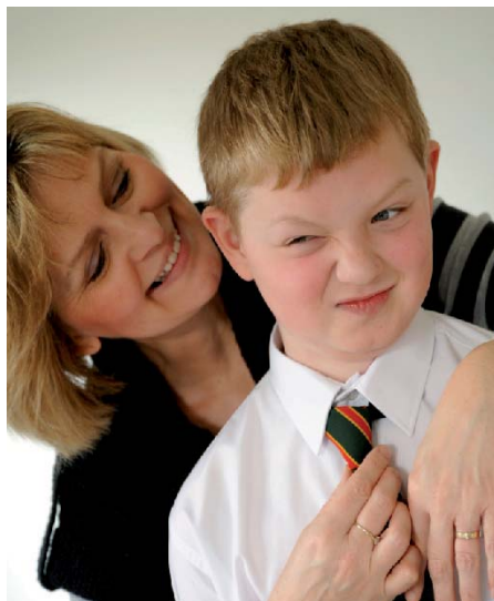
Miljöombyte är viktigt för barn och unga med funktionsnedsättning.

Om ni är intresserade och vill veta mer, kontakta oss så träffar vi gärna er för ytterligare information.