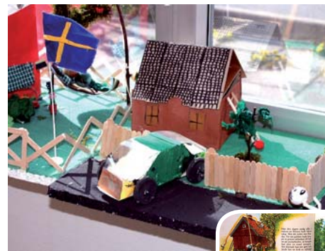
Utställningen byggde på sagan om Pettsson och Findus.

Bergaskolan 6–9 tog i våras initiativ till att söka pengar för att genomföra ett projekt där man utifrån sagor använder teknik. Flygvapenmuséet ville genomföra ett projekt kallat "Upptäck tekniken" och bidrog med 5 000 kronor.