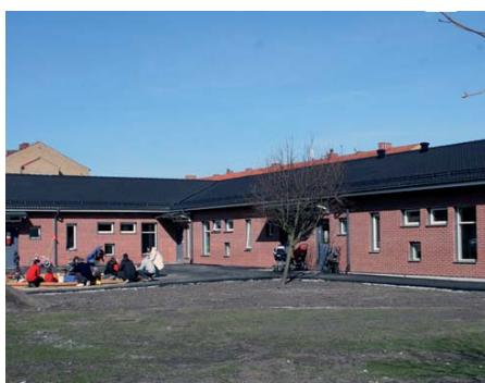
Flodillerns förskola öppnade den 1 april.