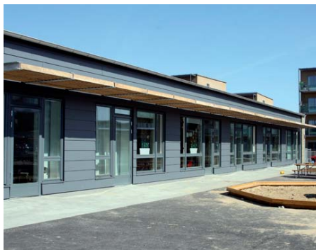
Sadelmakarebyns förskola i Bunkeflostrand invigdes den 3 april.

Den 1 april öppnade den nybyggda förskolan på Västanväg, strax intill Mathildensborg. Här finns 72 platser och 10 platser i utförskola. Samtidigt stängde Linné förskola på Idrottsgatan.