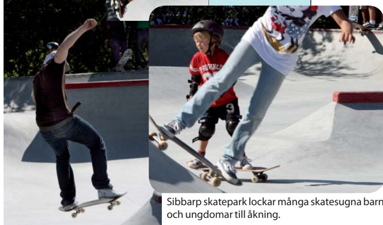
Sibbarp skatepark lockar många skatesugna barn och ungdomar till åkning.

På Malmö Ultra Bowl blir det pool-skating, fingerboard, street best trick, loppis, livemusik och andra roliga kringarrangemang. Poolen kommer i år att målas av konstnären David Shrigley.