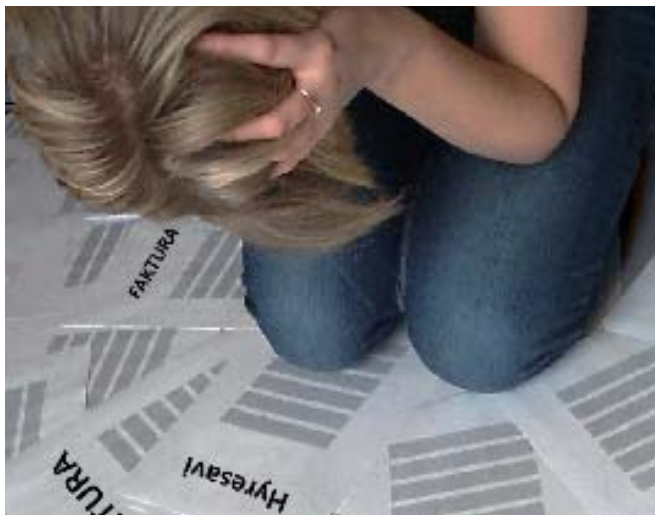
Antalet hushåll med behov av socialbidrag av ökat. Ökningen ligger nästan helt på ensamstående hushåll utan barn. Framförallt är det ungdomar som i högre utsträckning söker socialbidrag.

Den som söker socialbidrag ska bland annat redovisa sina tillgångar, visa utdrag från bank- och andra konton samt självdeklaration. Den sökande ska också ge sitt medgivande till att socialtjänsten, vid behov, får ta del av uppgifter från andra myndigheter, exempelvis bilregister, försäkringskassan och arbetsförmedlingen.