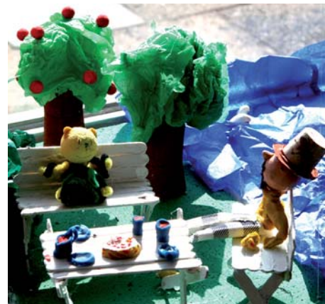
Eleverna i skolår 6 läste valda sagor för eleverna i skolår 2. Därefter började planeringen av bygget.