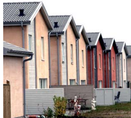
Utbyggnaden uppfattas som positiv av de som bor i området.

För att få veta vad Malmöborna tycker om de nya områdena i Bunkeflostrand har gatu-kontoret genomfört en enkätundersökning.