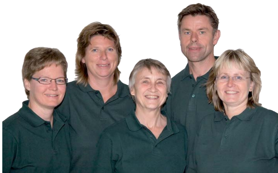
Veterinärgruppen i Tygelsjö hälsar våra husdjur välkomna till den nyöppnade kliniken.

Mitt i Tygelsjö har ett gammalt laboratorium förvandlats till en veterinärklinik. Bakom förvandlingen står fem veterinärer som alla har en bakgrund på Djursjukhuset i Malmö. Hundar, katter, fåglar och mindre däggdjur är alla välkomna till Veterinärgruppen.