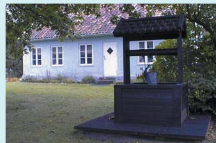
Limhamns Museum visar nu utställningen "Skepp O Hoj, Öresund!"