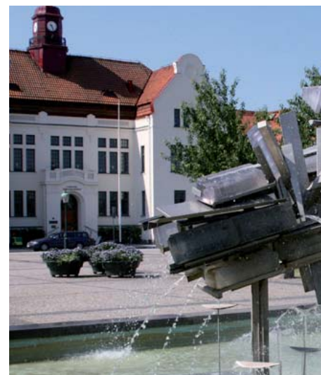
På Limhamns församlingshus finns nu tisdagscafé för ungdomar i grundskola- och gymnasieskola.

I Limhamn finns en del ungdomar som går i grundskola-/gymnasieskola. Ungdomarna har ofta begränsade valmöjligheter när det gäller aktiviteter utanför hemmet. Caféet vänder sig även till ungdomar utanför Limhamn.