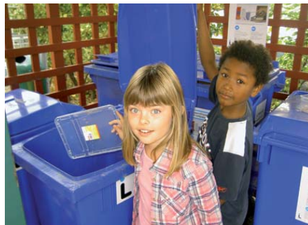
Eleverna i stadsdelens skolor arbetar aktivt med miljöfrågor.

Andelen skolelever som är behöriga till gymnasieskolans nationella program är fortsatt högt i stadsdelen. För att skapa bra förutsättningar för det individuella lärandet arbetar skolorna flexibelt, tematiskt och ämnesövergripande samt anpassar elevgruppernas storlek efter behov. Social och emotionell träning finns schemalagd i alla skolår och på alla skolor. Daglig fysisk aktivitet, eller hälsoskola i annan form, finns på samtliga rektorsområden.