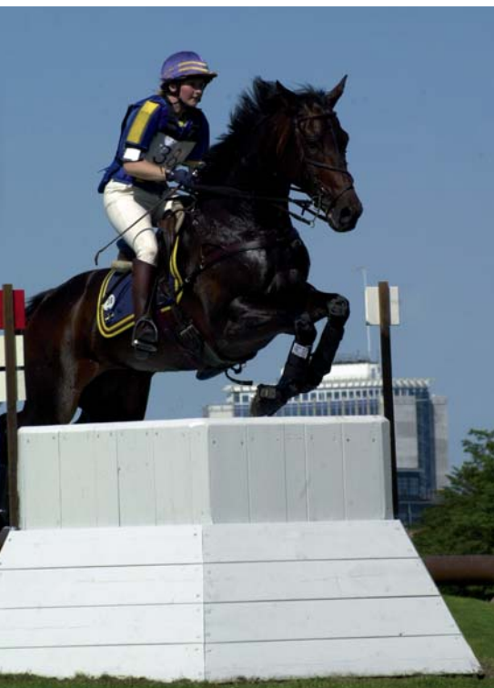
Malmö City Horse Show kommer till "Ribban" i maj. Arrangemanget har fri entré.

Text: Frida Jeppsson