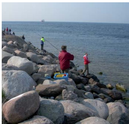
Den 10 maj arrangerar SFP Gripen den stora fisketävlingen på Ön.