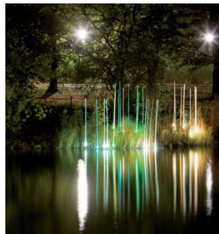
Ljusarrangemanget :by light i Slottsparken uppskattades mycket av Malmöborna.