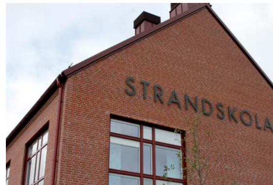
Mötesplats Strandskolan i Klagshamn.

Tekniska nämnden har fått 16 miljoner kronor för åtgärder mot almsjukan, förbättring av cykelbanor och för att åtgärda eftersatt underhåll på gator, broar och kajer i Malmö. Av de 16 miljonerna ska 5 miljoner kronor användas till åtgärder mot almsjukan, sex miljoner till upprustning av cykelbanor medan 5 miljoner avser övriga underhållsåtgärder.