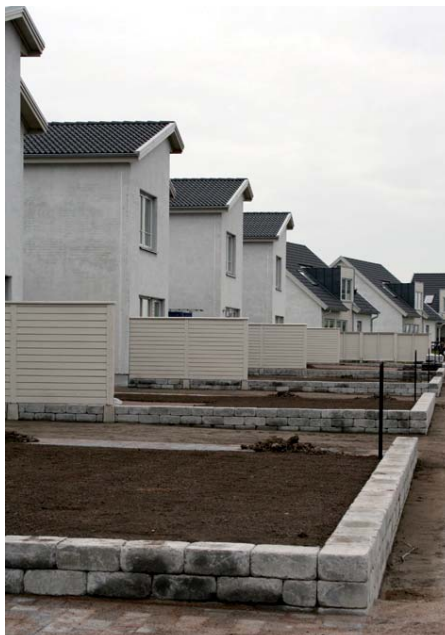
Anledningen till att befolkningen ökar mycket i Limhamn-Bunkeflo är den stora utbyggnaden i området.

De stadsdelar som växte mest under 2008 var Centrum och Limhamn-Bunkeflo. En förklaring till ökningen i Limhamn-Bunkeflo är att det byggts mycket i området.