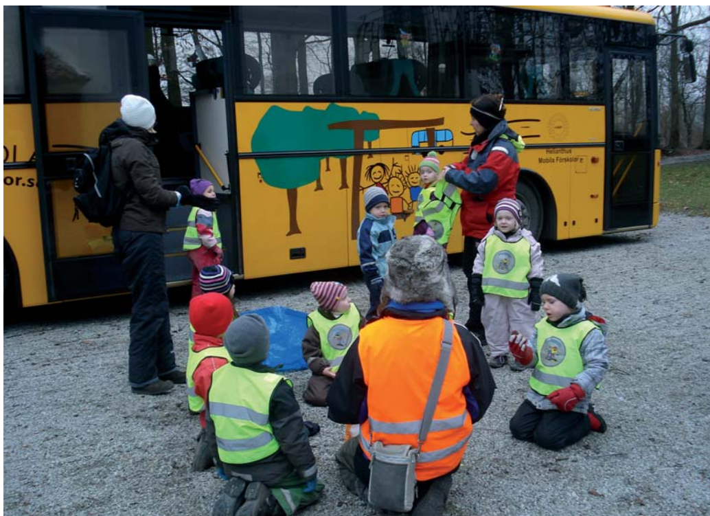
Barn från Rosenvängs och Älgårdens förskolor i Limhamn fick i januari möjlighet att under en dag prova den mobila förskolan.

Under eftermiddagen fanns möjlighet för intresserade att besöka bussen när den uppställd på Apoteksgatan, Limhamn. Flera av politikerna i Limhamn-Bunkeflo stadsdelsfullmäktige passade på att se detta alternativ till förskola. Beslut om att införa mobil förskola i Limhamn-Bunkeflo har ännu inte fattats.