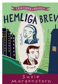
Hemliga brev av Susie Morgenstern

Den här fina boken handlar om tioåriga Ernest. Ernest mamma är död och hans pappa försvunnen och han bor hos sin gammalmodiga farmor där det inte händer något skoj alls. Ernest kan man beskriva som en ganska allvarlig liten ensamvarg. Men så en dag börjar Victoire de Montadent i Ernest klass.