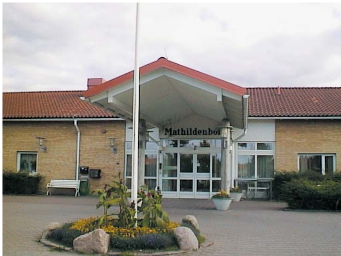
Malmö stads nya trygghetshotell öppnar på Mathildensborg i april.

I april slås portarna upp för Malmö stads nya trygghetshotell på Mathildensborg. Då kan Malmöbor som är fyllda 80 år checka in för 1–14 dagars vistelse. Hotellet finns till för de som tillfälligt behöver trygghet eller stöd, byta miljö eller känner sig fysiskt trött.