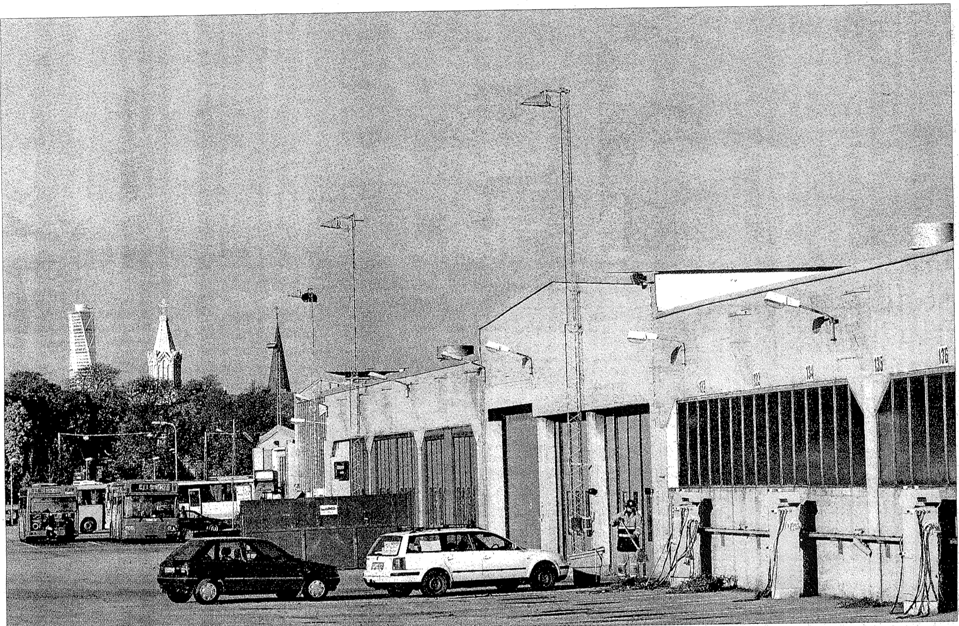
En bit Malmöhistoria. Turning Torso från 2005, S:t Pauli kyrka från 1882, S:t Petri kyrka från 1300-talet och kollektivtrafikens uppställningsplats som började byggas upp med stallar för hästspårvagnar 1906.