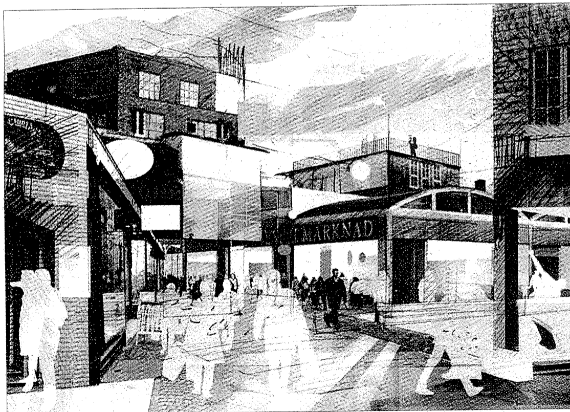
ILLUSTRATION: DAVID WIBERG

Det ska bli en brokig miljö. Gruppen bakom programmet vill dela in kvarter och fastigheter i små bitar för att undvika stora bostadskomplex och dominerande byggherrar.