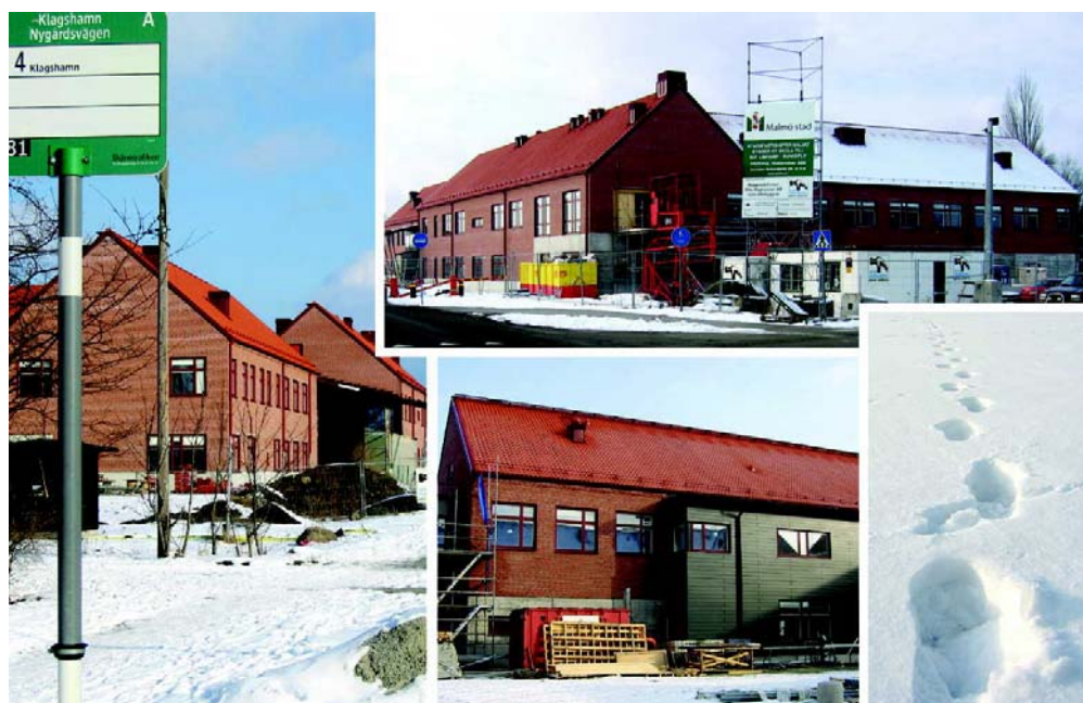
Strandskolan i Klagshamn.

Upprättad Datum: Version: Ansvarig: Förvaltning: Enhet: 2008-02-14