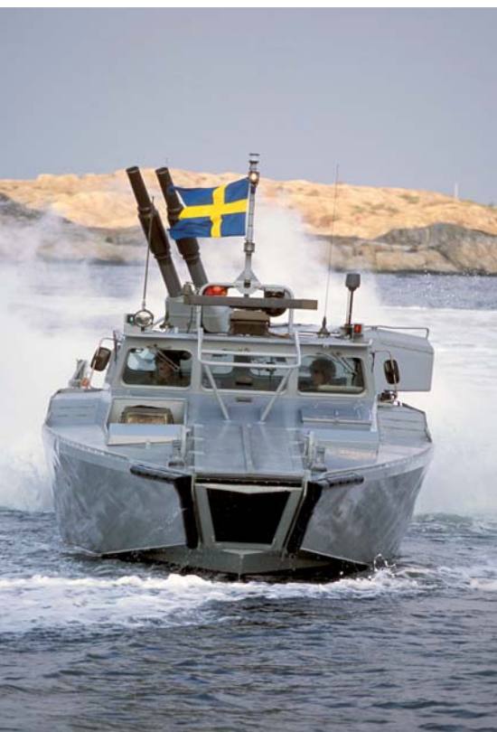
Stridsbåt 90 är främst anpassad för kustnära verksamhet.

I Limhamn-Bunkeflo kommer övningen att äga rum på flera platser. Lördagen den 2 juni passerar styrkorna bland annat Limhamn och Sibbarp med tunga stridsfordon.