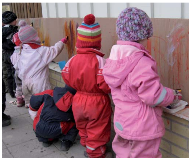
Barnen på uteförskolan "Upptäckarna" visade på invigningsdagen när de målade utomhus.