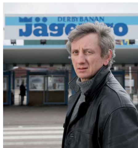
Personen på bilden är modell

Spelar du eller någon i din familj för mycket? Då kan du ta kontakt med spelberoendeteamet.