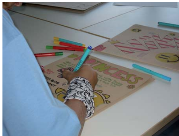
Regler för hur man visar respekt för varandra tas upp i likabehandlingsplanen som utarbetats för alla skolor i Malmö.

Antimobbningsteamet på skolan är välkänt bland eleverna och de löser konflikter och situationer tillsammans med klass-