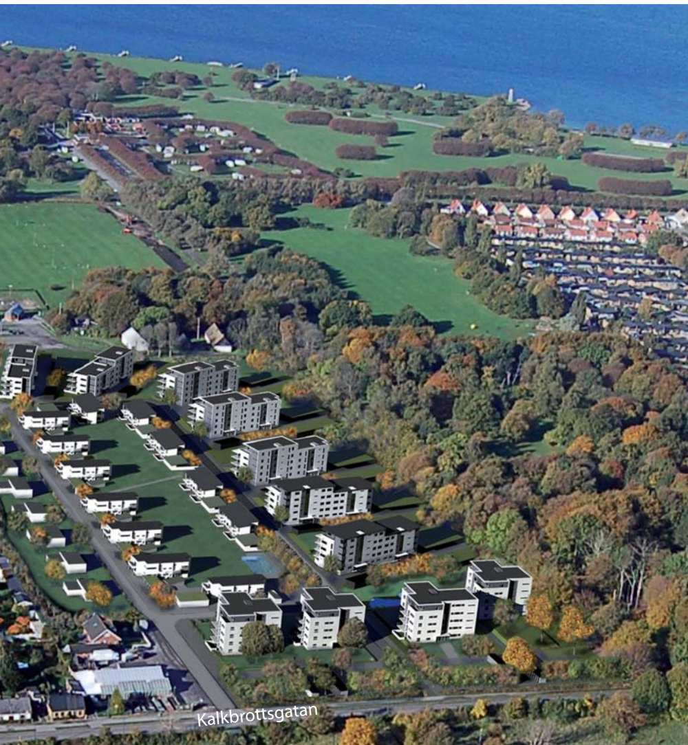
I mitten av februari började JM bygga de två första husen. De kommer att ligga med gaveln ut mot Hammars park.

Den andra etappen innebär ytterligare 34 hus och påbörjas någon gång under sommaren.