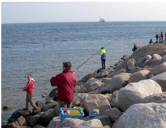
Den 13 maj klockan 9–13 är det dags för den stora fisketävlingen på Ön. Sundets "silver" ska fångas.

Förutom tävlingsintresserade sportfiskare lockar dagen många nyfikna besökare i sann folkfestanda. Sedan några år tillbaka är det sportfiskeklubben Gripfen som arrangerar den årliga fisketävlingen.