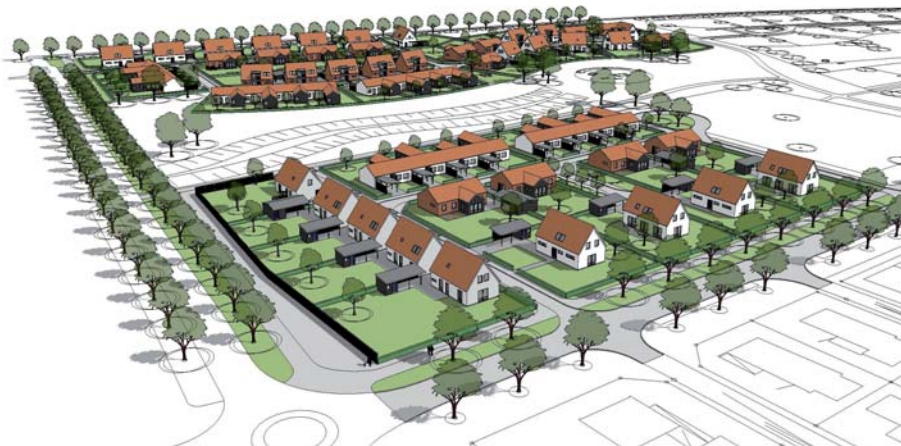
En ny villabebyggelse breder ut sig norr om Laavägen i Tygelsjö.