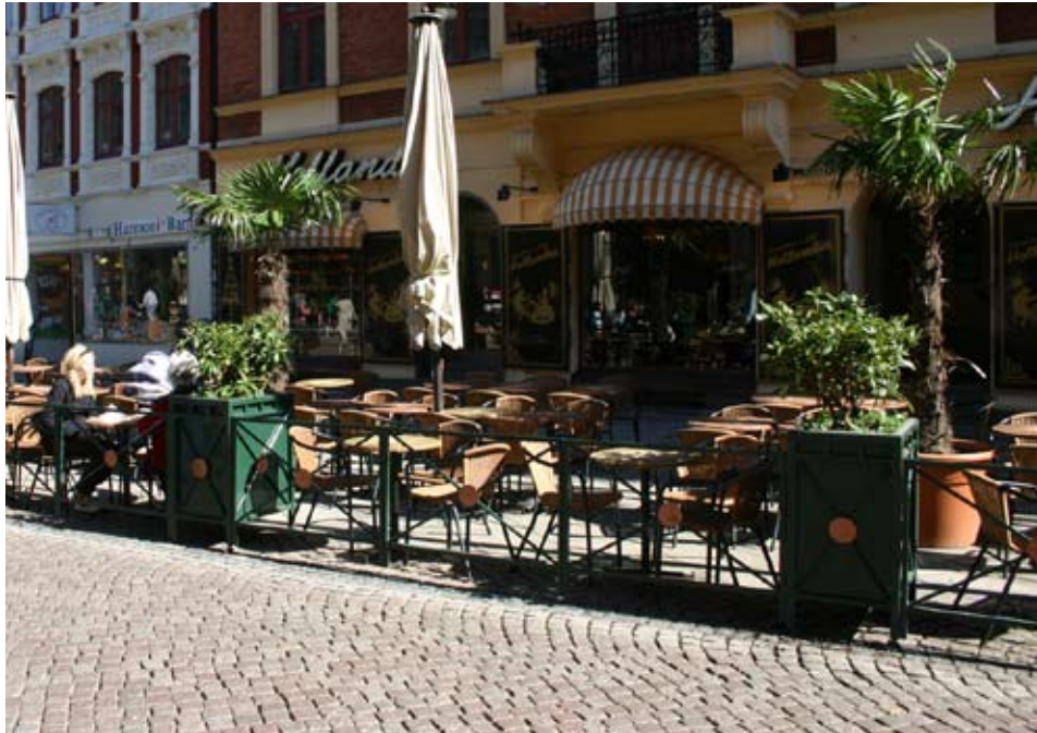
Uteserveringens möbler ska stå direkt på befintligt golv