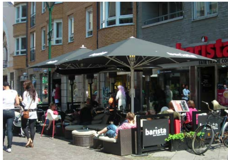
Uteserveringens avgränsningar får inte borraras fast i markstenen utan ska vila löst på underlaget