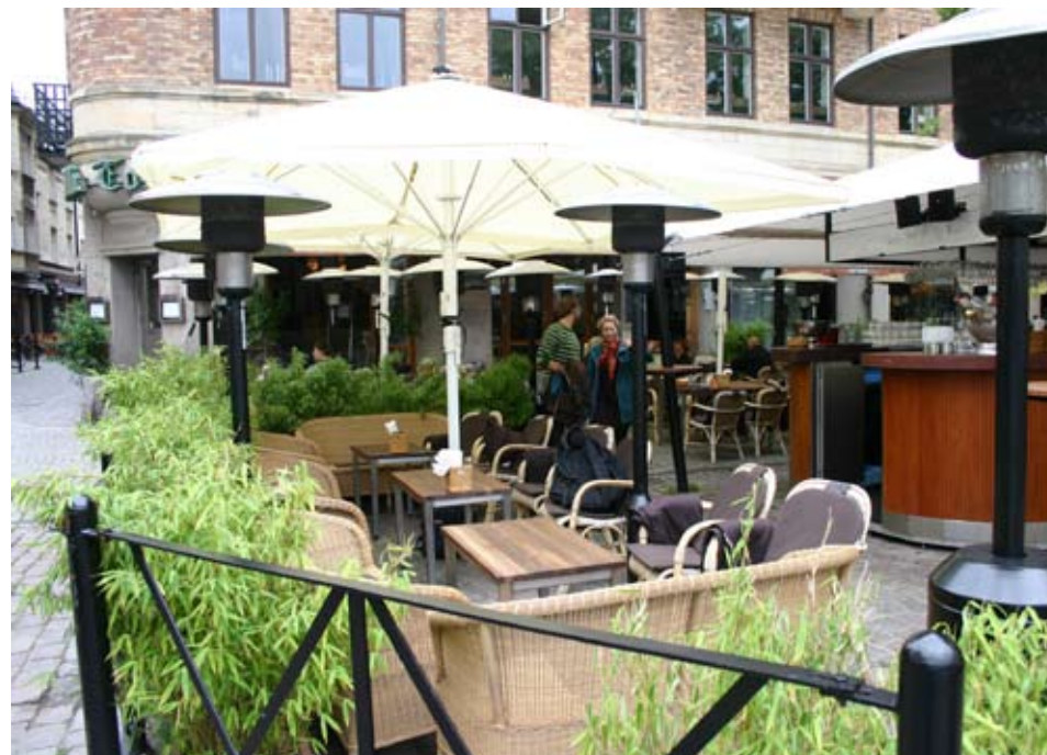
Parasoller i ljusa färger förordas

Varumärkesreklam på parasoller och markiser tillåts inte. Restaurangens logga eller namn får förekomma.