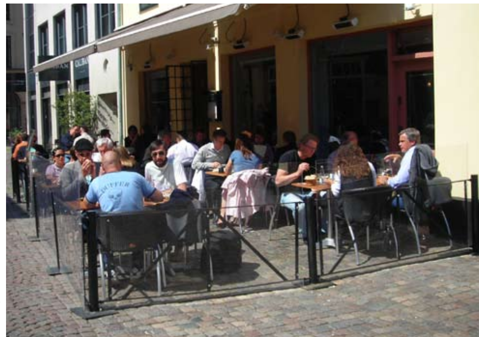
Uteserveringens avgränsningar får inte var högre än 1,10 m

När avskärmningarna skall placeras på trottoarer och torg får de inte borraras fast i gatstenar och betongplattor. I stället ska staketen vila löst ovanpå underlaget. Tyvärr utsätts ofta avskärmningar för klotter. Att omsorgsfullt sköta uteserveringen genom att exempelvis ta bort klotter, vattna blommor, är givetvis restaurangägarens ansvar.