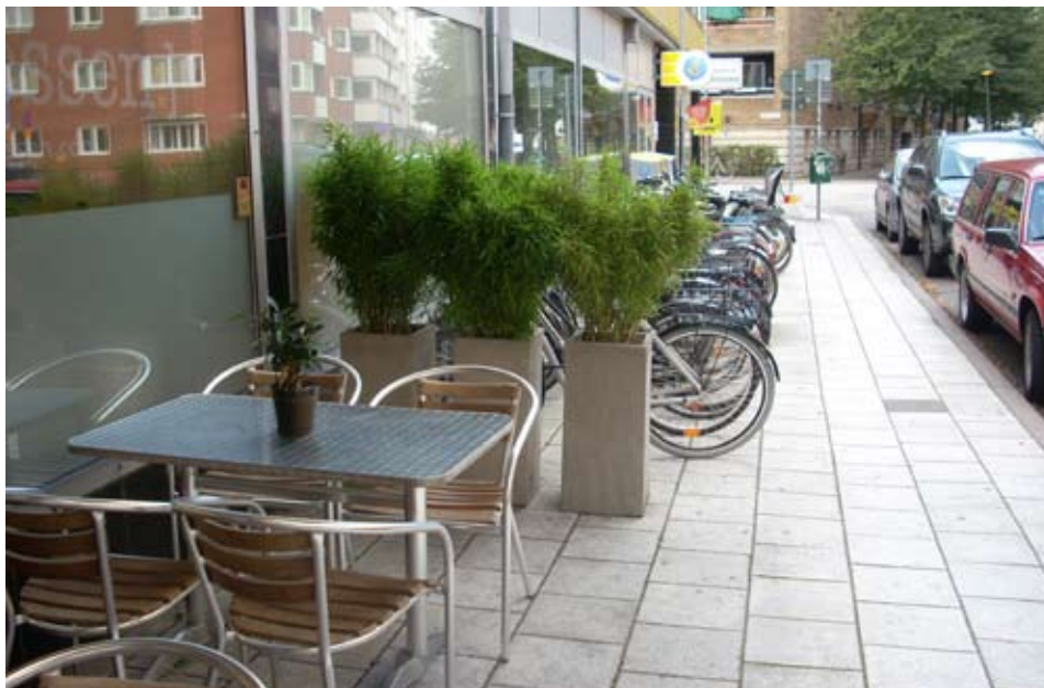
Möblerna på uteserveringen kan varieras i utformning och material men vit färg bör undvikas