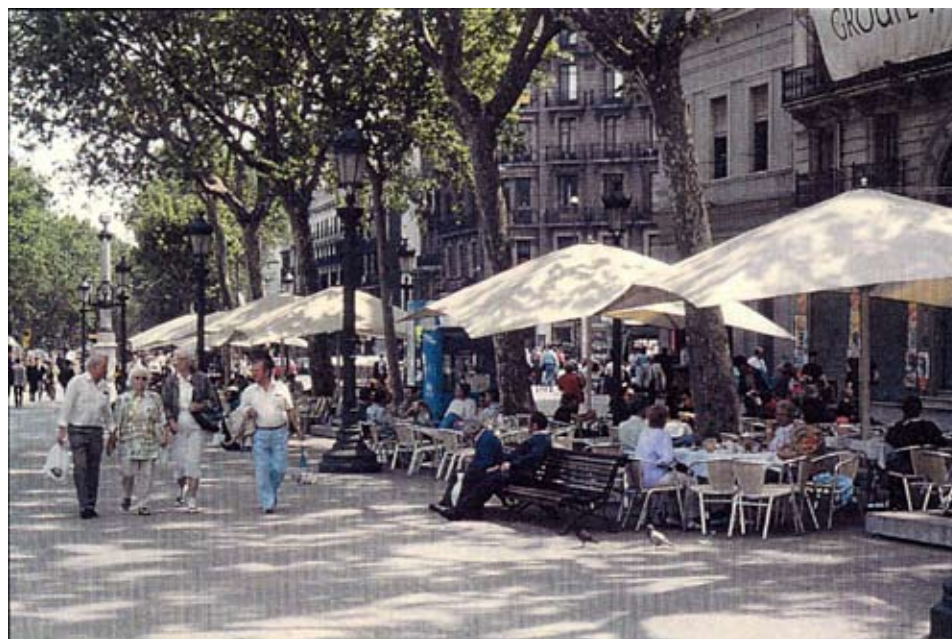
Likaså har uteserveringarna på Las Ramblas i Barcelona gemensam utformning