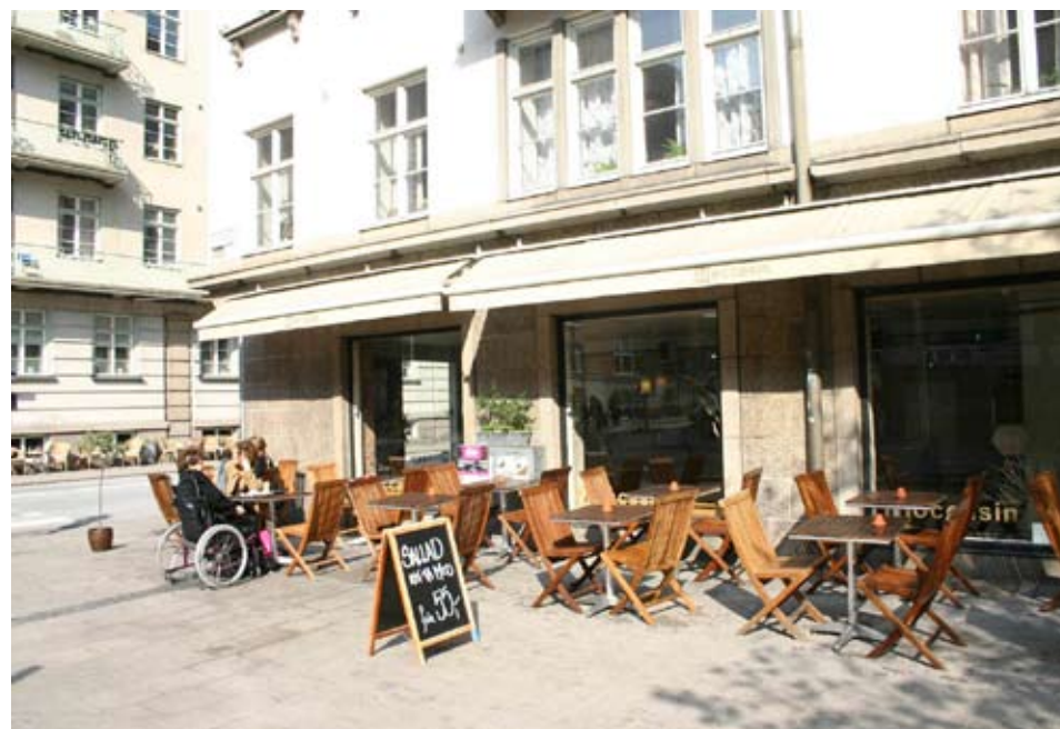
Fritt hängande markiser utan stödben tillåts