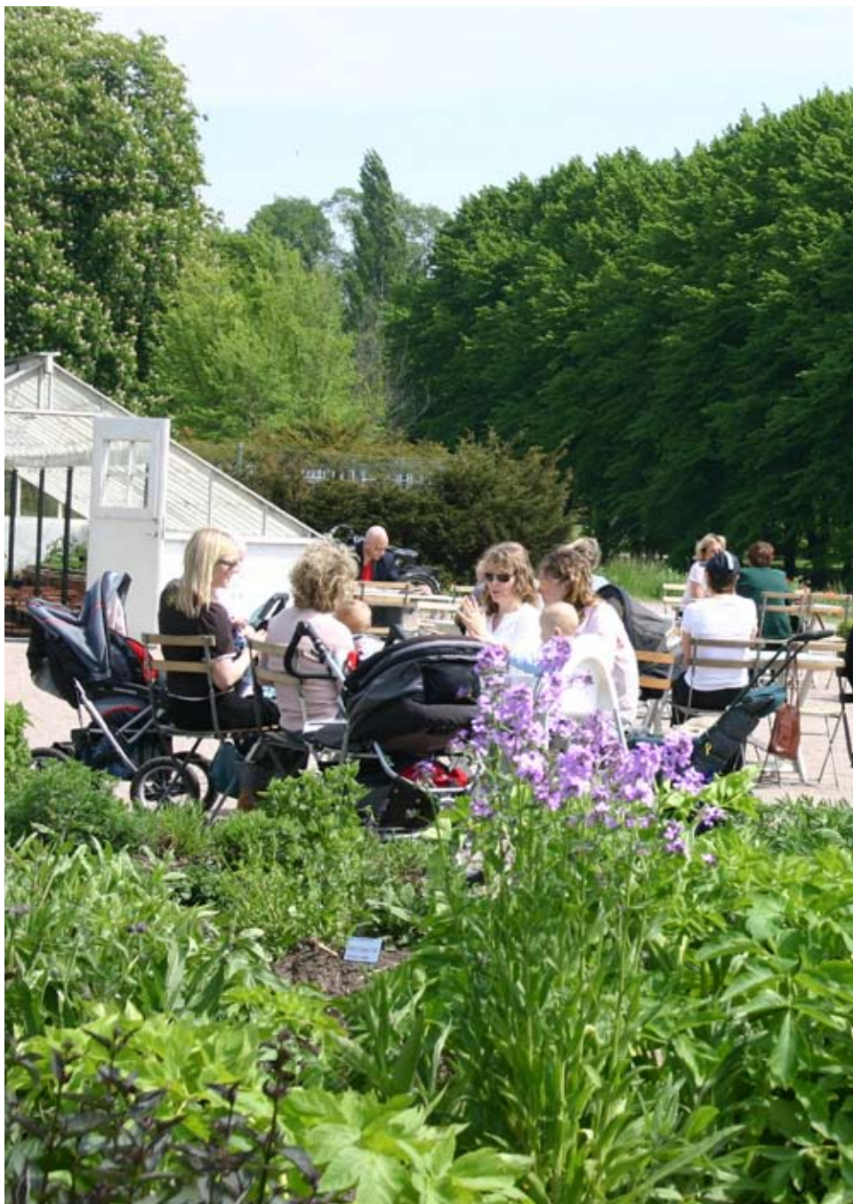
Uteserveringen är en viktig del i att marknadsföra en restaurang eller ett café