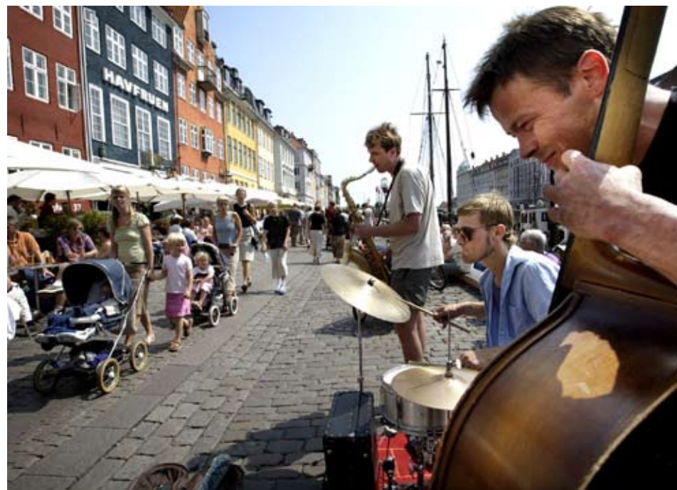
Uteserveringarna på Nyhavn i Köpenhamn är likformiga

Att Malmö stad ställer krav på hur den allmänna platsen används är inget som gör vår stad unik. Liknande riktlinjer finns idag i stort sett varenda stad och i en europeisk jämförelse är Sverige försiktig när det gäller styrningen. Exempel i Europa där strikta regler gäller för att få erhålla ett sammanhållet grepp är uteserveringarna utmed Ramblas i Barcelona och i Nyhavn i Köpenhamn.