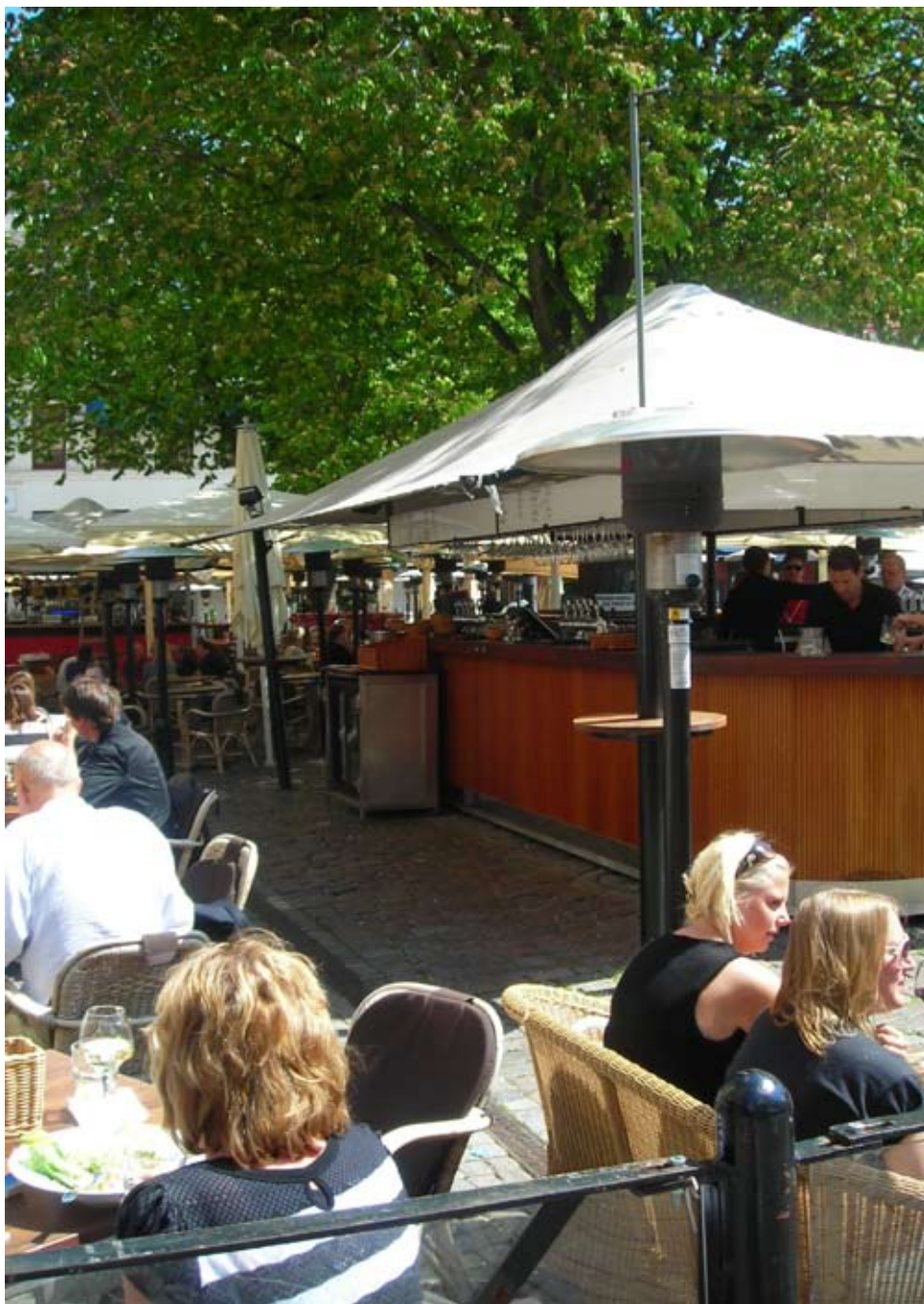
Barer på uteserveringen ska vara genomsiktliga och inte dominera uteserveringen