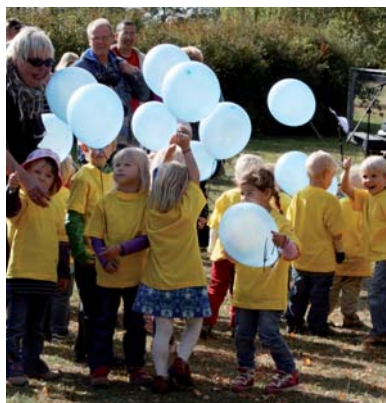
Alla barn på Elinelundsområdet höll hårt i sina ballonger tills startskottet gick för det stora ballongsläppet.