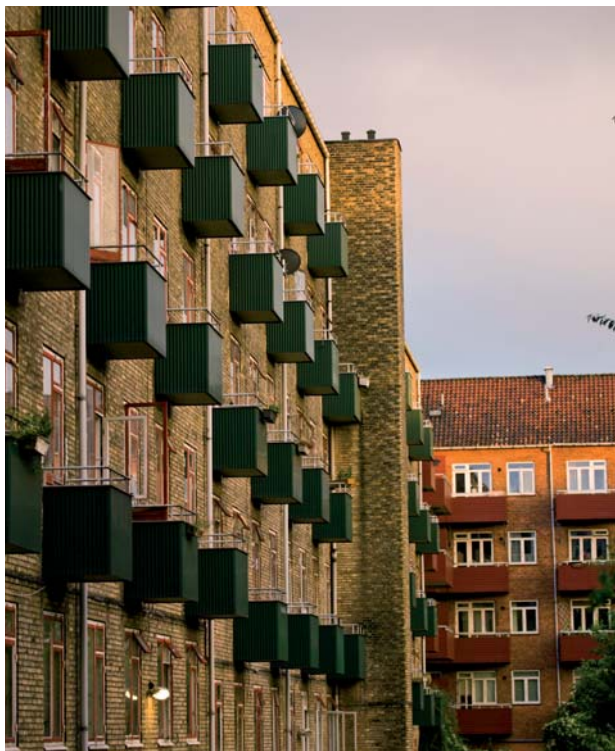
Stadsdelen har inte någon förmedling av bostäder. Rådet är att vända sig till hyresvärdar eller Boplats Syd (se mer information till höger).