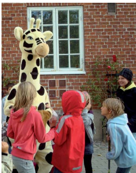
Sex nya skolor som startat med Vänlig väg höstterminen 2009 finns i Limhamn-Bunkeflo.

För att få delta i projektet krävs att varje skola skriver en avsiktsförklaring – som alla föräldrar måste ta del av – som klargör att skolan aktivt förespråkar att barnen kommer till skolan på annat sätt än i bil.