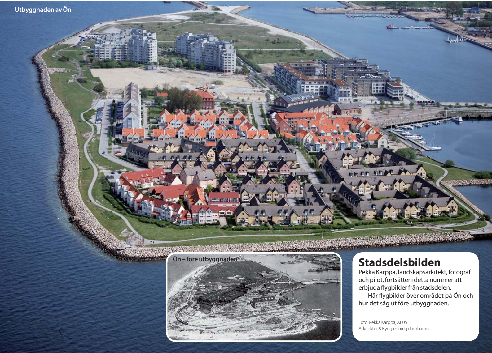
Ön – före utbyggnaden