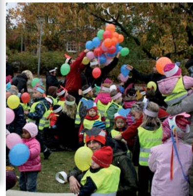
Ballonger i olika färger släpptes upp av alla "flodillrarna" när Flodillerns förskola invigdes.