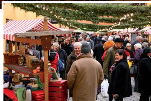
Den 29 november inleds julen i Malmö med skyltsöndag och julmarknad.

levande djur, samt försäljning av hantverk och julgotter. Denna dag är det fri entré.